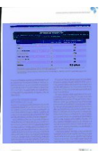
FIGURA 3. PERÍODOS DE RENOVACIÓN NECESARIOS PARA CADA INFRAESTRUCTURA DEL CICLO URBANO DEL AGUA

Valor patrimonial y necesidades de inversión en la renovación de las Infraestructuras del ciclo urbano del agua AEAS-UNED Aqueae-UPC