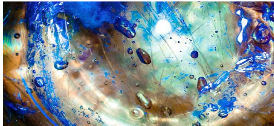
Photoaquae 2017: Aut@r jenpephotography

Para garantizar el cumplimiento de sus fines, así como de la visión y objetivos establecidos en sus estatutos, el Patronato de la Fundación Aquae fija cada cinco años, sus líneas estratégicas de actuación, recogidas en el Plan Director.