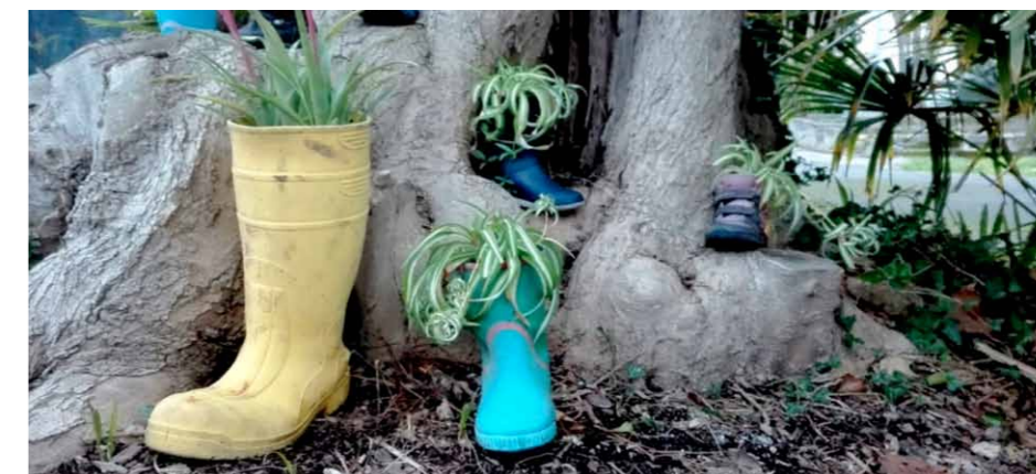
Photoaquae 2017: Aut@r Eider Sanz Iturralde.España