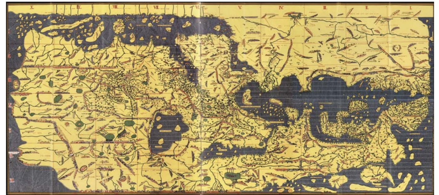
Tábula Rogeriana- Durante 15 años, al-Idrisi trabajó en lo que sería el mapa más importante de su época

Se trata de una parte, de El libro de Roger , un atlas con el que al-Idrisi revolucionó la cartografía del mundo conocido en los albores del siglo XII y cuya vigencia se mantendría a lo largo de varios siglos, acompañando incluso a Cristóbal Colón en su expedición a América. Los mapas de al-Idrisi, fueron también de gran valor militar y comercial por su detallada información en torno a las distancias entre ciudades y por sus exhaustivos datos sobre su clima, situación de acuíferos, cultivos y rutas de acceso.